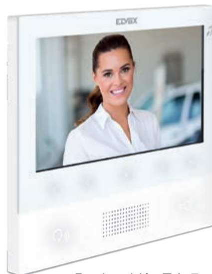
Portier-vidéo Tab 7