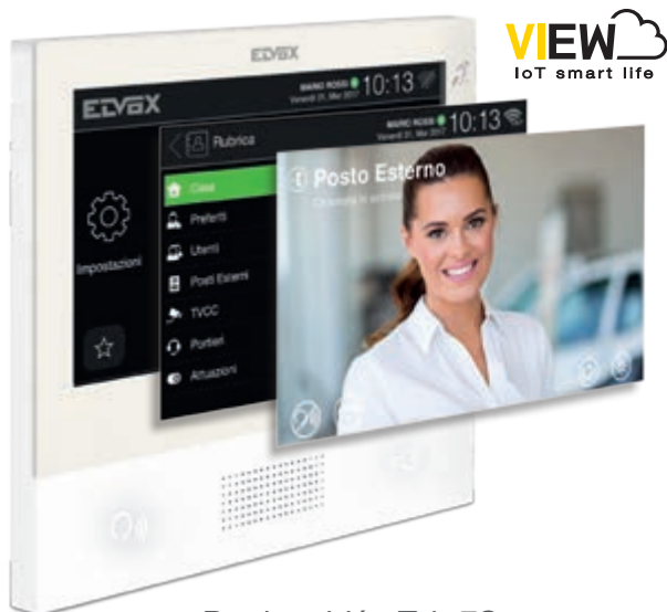
Portier-vidéo Tab 7S